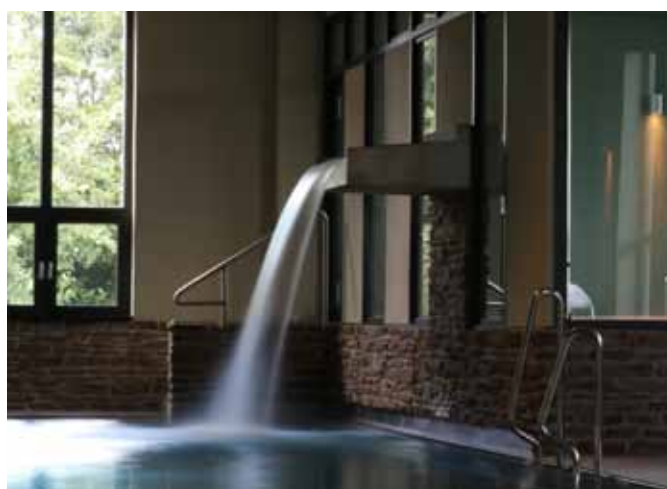
Links oben: Das Dampfbad ist modern gestylt und bietet viel Platz. Rechts oben: Sanfte Wärmestrahlung hüllt im Tecalдарium die Badenden ein. Unten links: Wärmeliegen und eine Wärmebank mit Fußbecken sind in der Schwimmhalle integriert. Unten rechts: Aus einem Edelstahlkasten an der Wand entspringt der Wasserfall, der sich ins Becken ergießt.

Hochwertige Materialien, dabei vor allem Stahl und Glas prägen das Bild und geben dem Raum einen modernen Charakter. „Man soll sehen, dass es sich um einen Neubau handelt“, erläutert Schroeder weiter. Abgesehen von den Umfassungswänden blieb sonst nichts bestehen. In den Gebäudekörper wurde aufwendig eine Stahlkonstruktion eingezogen, die eine Zwischendecke trägt. Im neu geschaffenen Obergeschoss befinden sich jetzt Seminarräume, im Untergeschoss die Schwimmhalle.