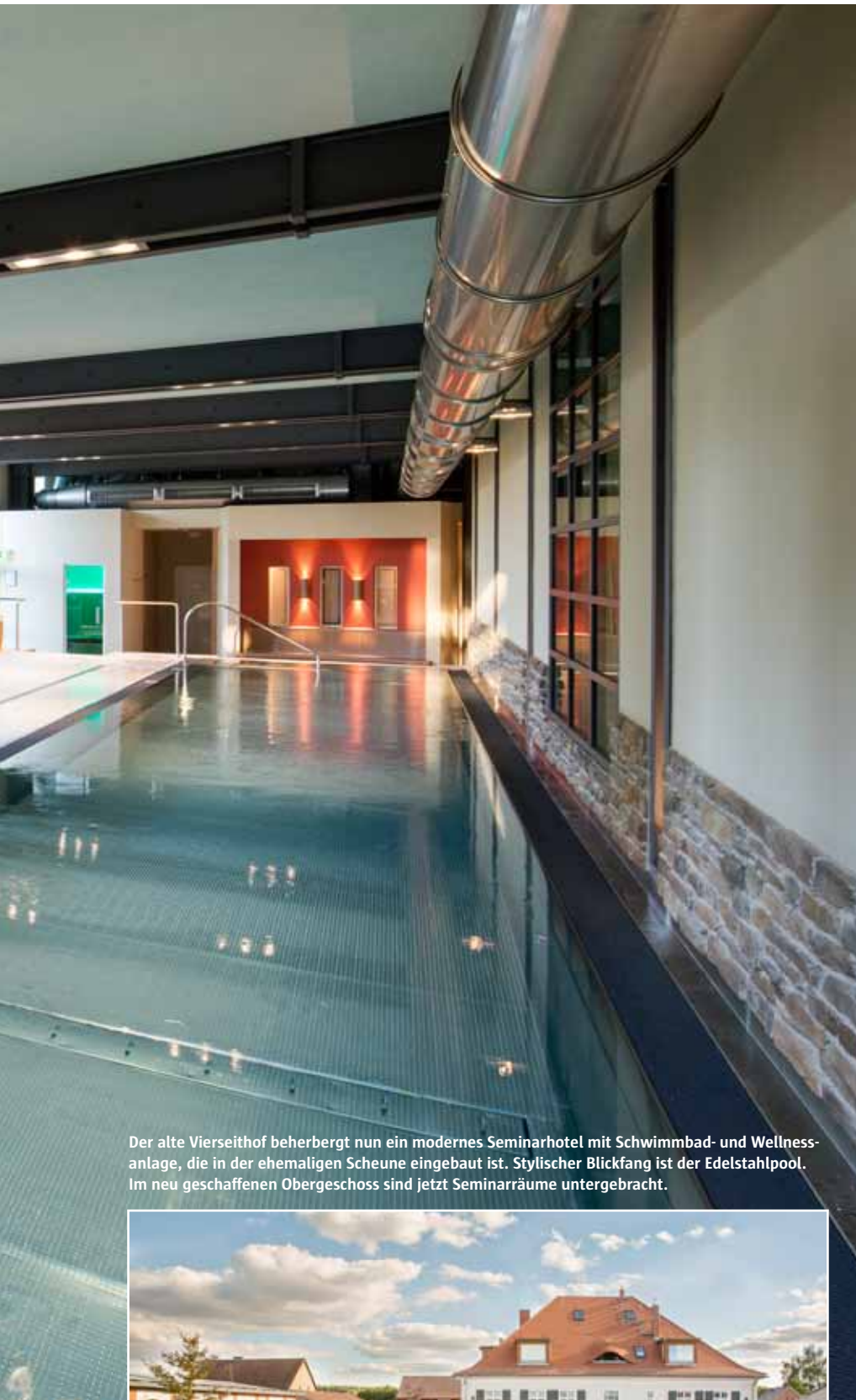
Der alte Vierseithof beherbergt nun ein modernes Seminarhotel mit Schwimmbad- und Wellnessanlage, die in der ehemaligen Scheune eingebaut ist. Stylisher Blickfang ist der Edelstahlpool. Im neu geschaffenen Obergeschoss sind jetzt Seminarräume untergebracht.