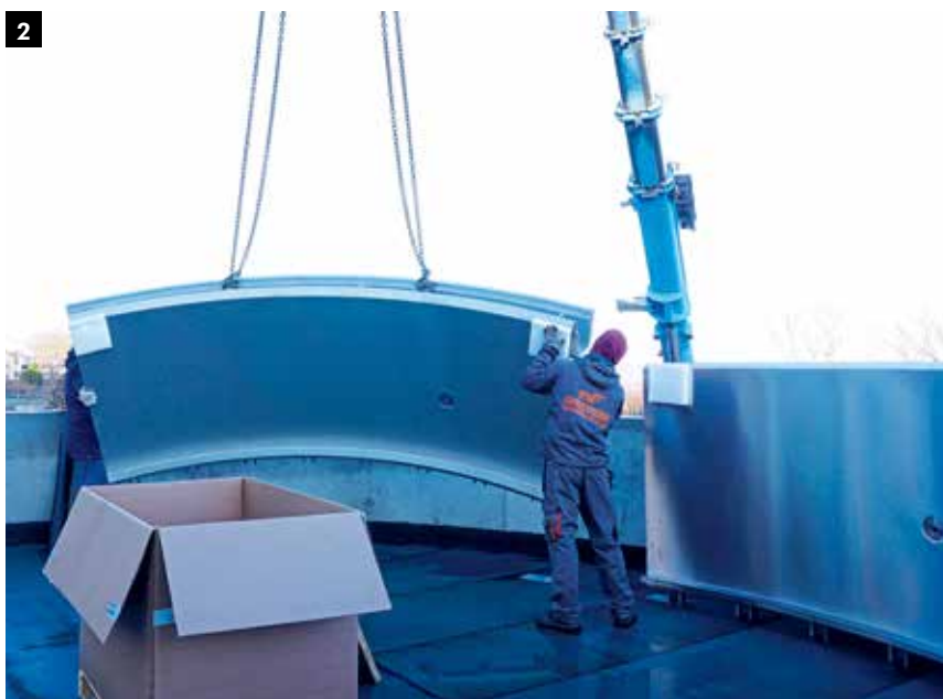
2 Mehrere Firmen waren an der Planung und Realisierung des Pools beteiligt.