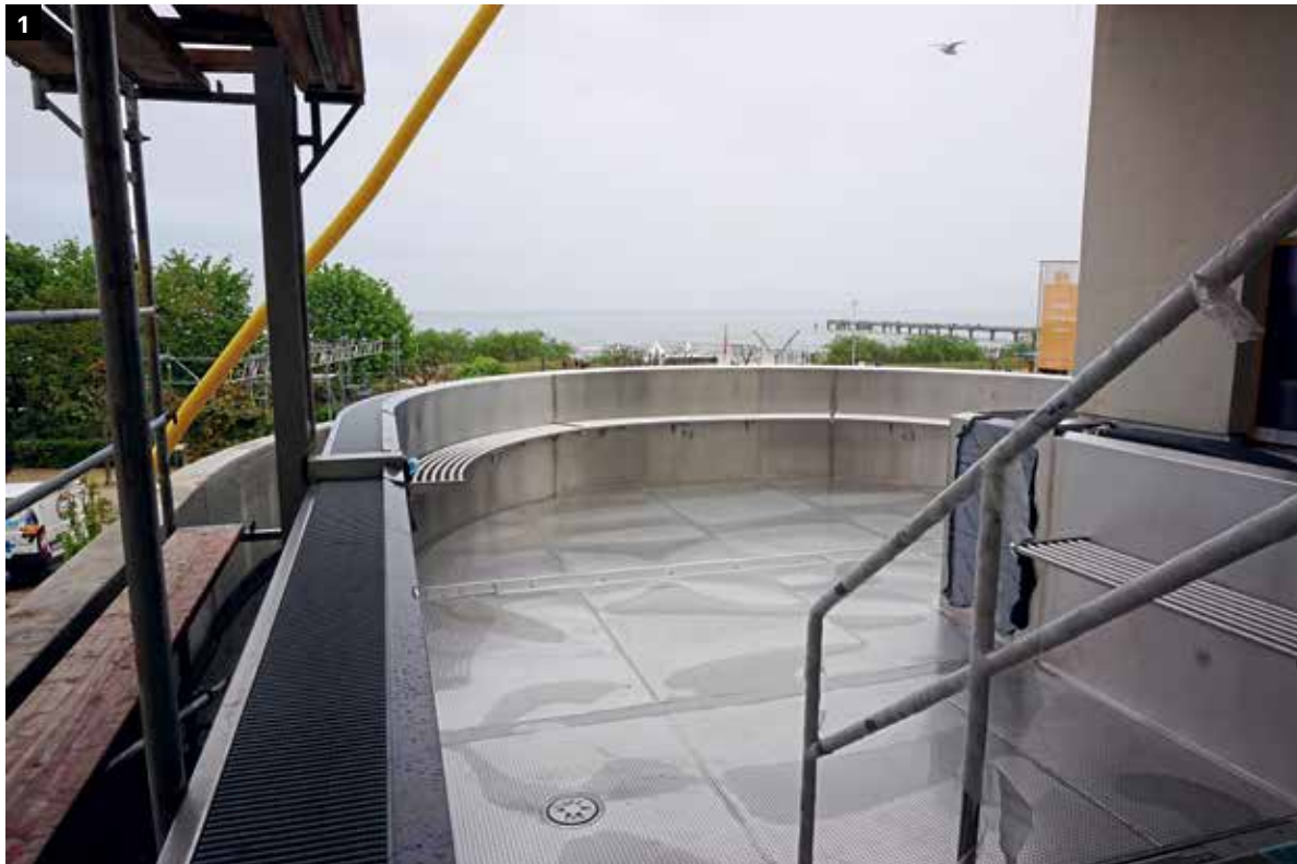
1 Das Edelstahlbecken umfasst 57 Kubikmeter und ist von außen isoliert.